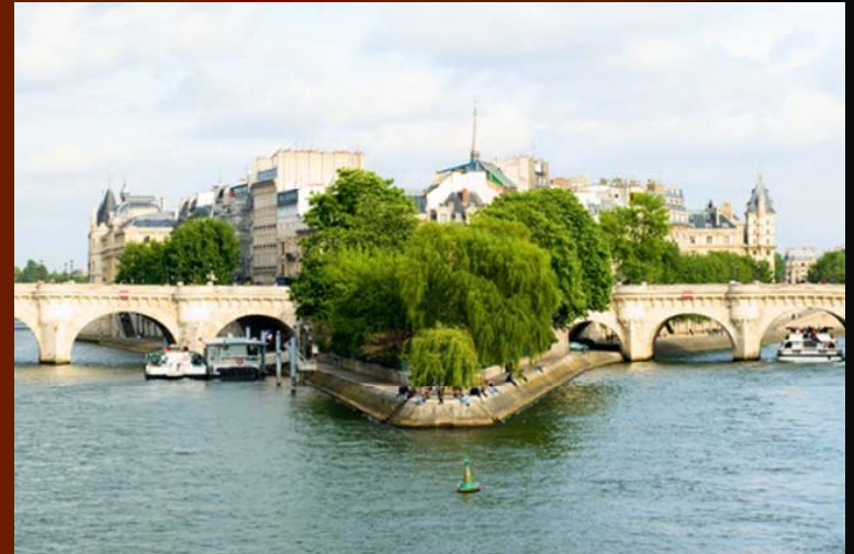
Ile la cite